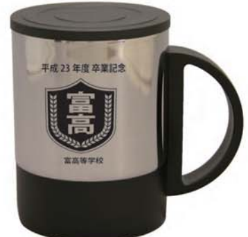
Z-321 フタ付きステンレスマグカップ

サイズ：70φ×80mm 加工範囲：50×50mm 50個～ ¥525 (税抜 ¥500) (7F0) ステンレス (二重構造) ※名入れ代 (片面1色) ¥180 (税込) ※版代 (片面1色1版) ¥15,750 (税込)