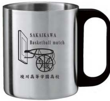
Z-320 ステンレスマグカップ

サイズ：70φ×80mm 加工範囲：50×50mm 50個～ ¥273 (税抜 ¥260) (7F0) 磁器 (カップ白色のみ) ※名入れ代 (片面1色) ¥185 (税込) ※版代 (片面1色1版) ¥21,000 (税込) ※磁器製品の追加はその都度版代が必要となります