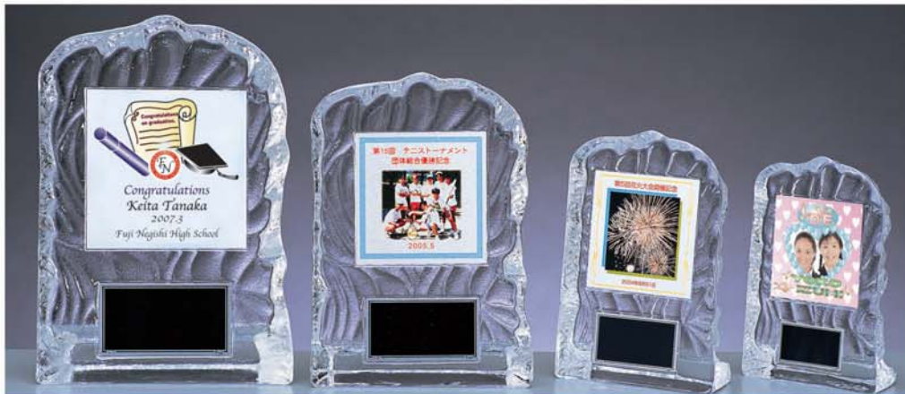
285-2 クリスタル転写楯

本体：195×135mm アルミ：85×85mm (V7) 1個～ ¥7,350 (税抜 ¥7,000) (7F0) 10個～ ¥7,140 (税抜 ¥6,800) (7F0) (プレート文字彫刻代別途)